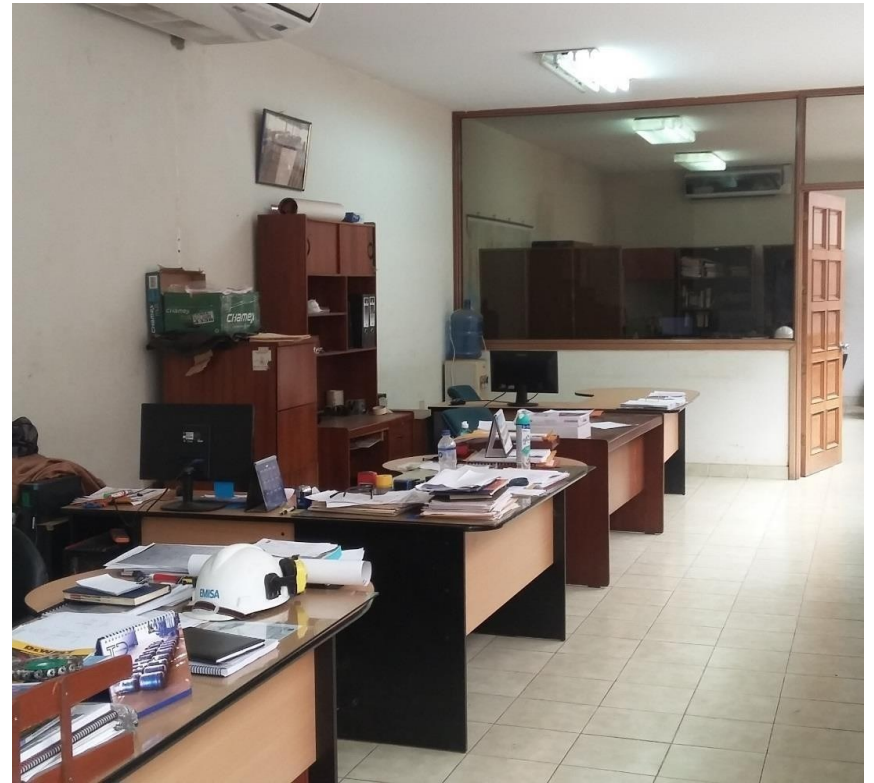
INTERIOR Y EXTERIOR DE OFICINAS COLINDANTES CON CALLE 1